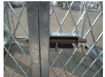
②：開き止めストッパー