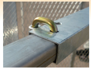
①：筋交部ストッパー