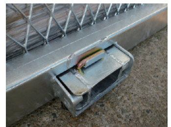
③：ツメ抜け止めストッパー