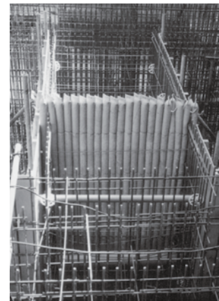
地中梁にセット完了時