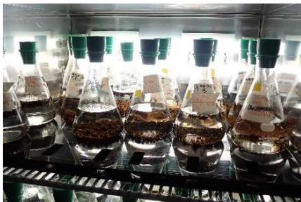
タネ（配偶体）培養 （フリー配偶体培養）

このたび多段式養殖施設を設置した隠岐諸島沿岸にはコンブの仲間よりも大型になるホンダワラ類（大型褐藻類）が生育しており、複数種類の養殖の有効性を検証いたします。養殖生産して収穫した大型褐藻は、食用や工業原料の他に CO2 吸収に優れている種類であることから、当社の事業分野である建材利用をはじめとしたさまざまな利用方法を検討しております。