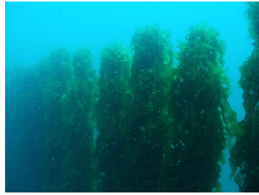
垂下方式での藻場用種苗の生産