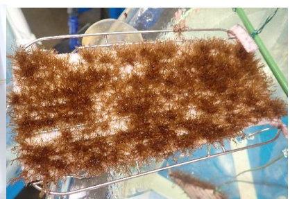
ホンダワラ類種苗