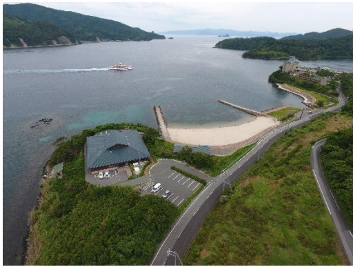
岡部(株)応用藻類学研究所